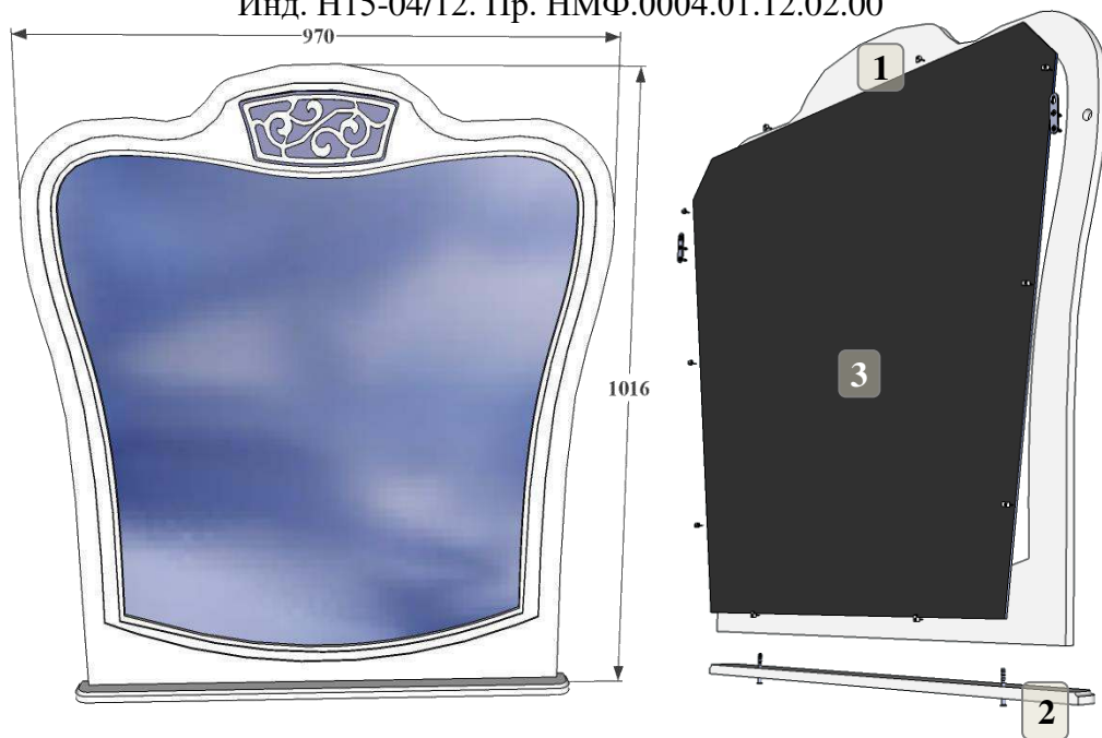
Инструкция по сборке

Инд. Н15-04/12. Пр. НМФ.0004.01.12.02.00